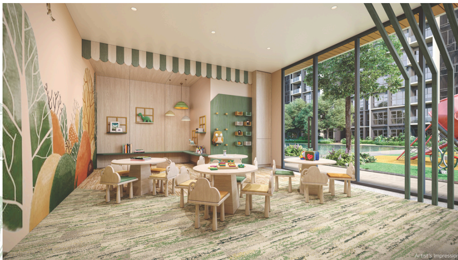
Kid's Party Room