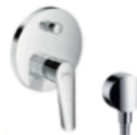
TYPE D2 ONLY