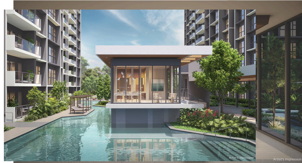
Gourmet Dining Room