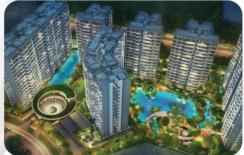
Parc Central Residences